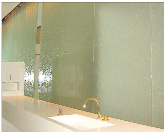
På Restaurant Vision i Malmø har man valgt at have vandvægge mellem restauranten og toiletterne, dvs. at der løber vand ned ad hele væggen.